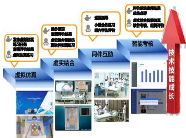
图 2 四级进阶实践训练模式

校院合作开发母婴集解剖基础、智慧实践训练、技能大赛转化、母婴照护服务等多维教学资源，根据教学内容灵活运用案例教学法、角色扮演法、小组讨论法等多种教学方法，恰当应用虚拟仿真软件等数字资源和信息化手段，突破教学难点。