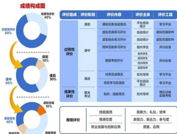
图3 多元评价体系构成图

课前通过自建在线课程学习平台获取学习数据,调整教学策略;使用母婴护理技能考核评价系统,课中组内自评、组间互评、导师评价,结合平台数据,综合分析目标达成情况;课后统计知识技能测验结果、社会服务参与情况,反馈优化教学策略,完善教学设计(图3)。