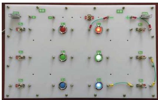
图 2：拆导线后灯泡正常发光演示电路

实验二，依次按下遥控器 1 至 8 号键（这个动作隐秘操作以增加实验神秘感）再次拨动三个开关，发现只有三个支路开关同时闭合情况下，三个灯泡同时亮起，断开任一个开关，三灯同时熄灭，这时并联电路显示出串联电路的特征。