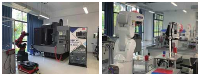
图1 工业机器人专业实训设备一角

工业机器人技术专业是典型的工科专业, 以智能电气装备、工业用机器人、各类机械手等设备为媒介, 培养服务于制造自动化领域的技术技能型人才的一门学科。2015年, 教育部结合市场需求和战略要求, 修订了高职(专科)专业目录及其专业设置管理办法, 将“装备制造大类”替换了原来的“制造大类”, “工业机器人技术”等新型专业设置在“装备制造大类”之下。工业机器人技术专业包含有《工业机器人在线编程》《工业机器人操作与运维》等专业课。