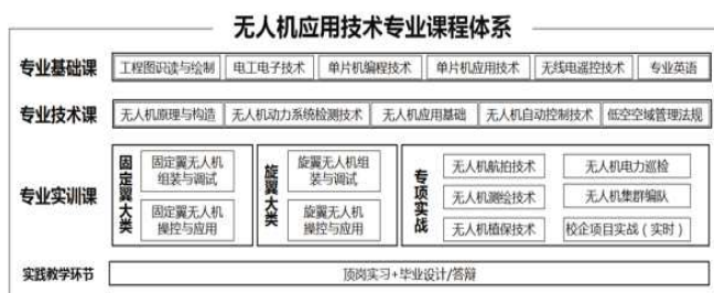
图2 无人机应用技术专业课程体系