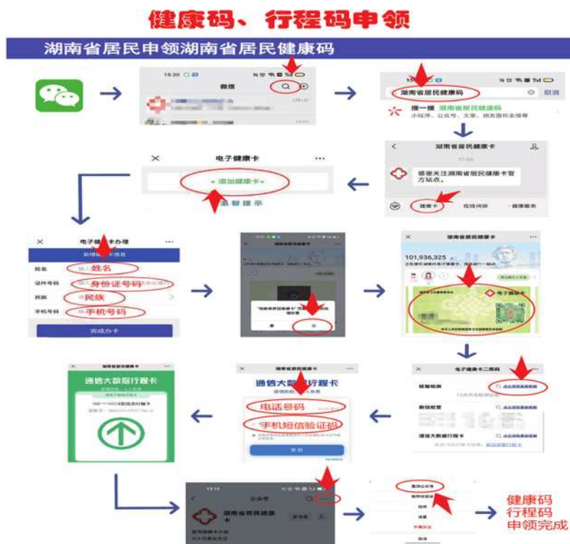
图 1 健康码、行程码申领

目前健康码和行程码是我们普罗大众出行、购物、就医等日常生活必不可少的“朋友”。相信大部分老年人已由亲朋好友告诉如何申领健康码与行程码。但考虑到老年人的忘性及公众号被聊天淹没等找不到健康码的情况, 本套手册优先向老年人介绍如何申领健康码、行程码, 以及如何置顶健康码。手册设计如图 1 所示。