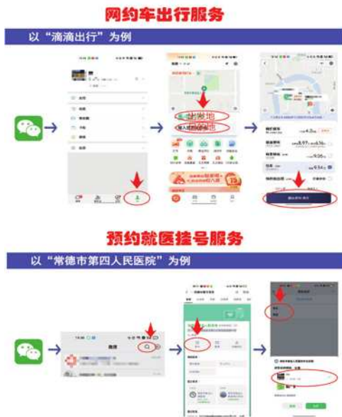
图 3 网约车出行服务、预约就医挂号服务