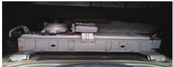
图 4 HV 蓄电池安装部位

f. 回收处理 HV 蓄电池注意事项，HV 蓄电池电解液是强碱性氢氧化钾溶液（无味，透明，无色），如有渗漏，需使用硼酸溶液进行中和电解液处理。更换下来的 HV 蓄电池需要严格执行厂家回收政策。更换的电池见图 5。