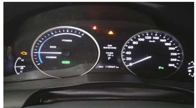
图1 故障车仪表显示信息

综合客户所描述的故障现象, 首先对车辆进行初步的试车检查, 发现车辆行驶过程中仪表一直显示“请检查混合动力系统”, 就车检查车身相关部件线路插头无异常, 试车行驶提速无力, 行驶过程中无法切换EV行驶模式。见图1。