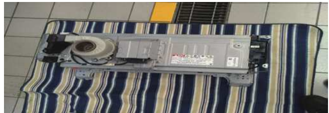
图 5 需更换的 HV 电池组

f. 回收处理 HV 蓄电池注意事项，HV 蓄电池电解液是强碱性氢氧化钾溶液（无味，透明，无色），如有渗漏，需使用硼酸溶液进行中和电解液处理。更换下来的 HV 蓄电池需要严格执行厂家回收政策。更换的电池见图 5。