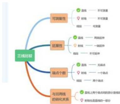
图2 三线比较思维导图