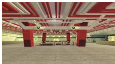
图5 地铁换乘空间设计效果图

换乘空间(如图5), 电梯通道处的入口设计结合古城门的形象符号, 吊顶与主入口的吊顶设计相融合, 采用折现结构, 体现回形符号的同时更将淹城的地域性特征再次凸显, 以现代化的设计手法呈现在乘客视觉之中, 鲜艳且符合大众审美。