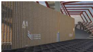
图2 出入口下层导视效果图