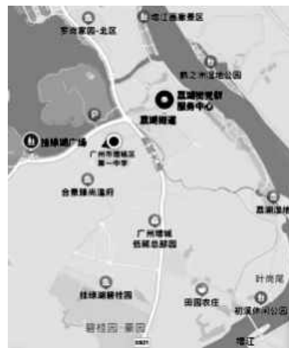
图 3 荔湖街区域图 (局部)

1. 利用百度地图截取增城某乡村的卫星影像,指出该乡村的主要土地利用方式和分布特征。