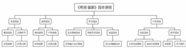
图二 园本课程体系

构建完整的园本课程体系的关键是确立教学目标和支架，将红色文化和课程融合，融入幼儿园的一日生活、游戏、主题教育和环境创设中。以大型传统节日为契机，开展相关主题活动，传承中华优秀传统文化；在幼儿的一日活动中大力弘扬、渗透民族精神和时代精神；借助每周一的升旗仪式，传承红色基因，结合新时代特点赋予新的内涵；开展社会实践活动激发爱国情感；做好幼儿园、班级内的环境创设，营造爱国主义的浓厚氛围。讲昨天的故事，立今天的品格，济明天的世界。