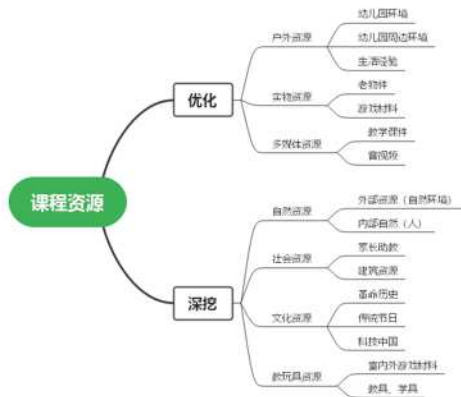
图一 课程资源的开发与利用

红色文化资源承载的丰富物质文化和精神文化，能为幼儿习惯养成和思想品德熏陶提供源源不断的教育素材。将红色文化融入到了幼儿园一日生活、主题教育和环境创设中，挖掘丰富的课程资源，让红色文化走进幼儿园，将红色文化资源融入幼儿园课程，能提升幼儿的人文素养和文化自信，促进幼儿全面发展，课程资源包含了园所文化资源、物质环境资源、教师资源、家长资源、社区资源、地方本土资源、数字化信息资源等，遵循共享性原则、经济性原则、适应性原则、实效性原则、因地制宜原则。