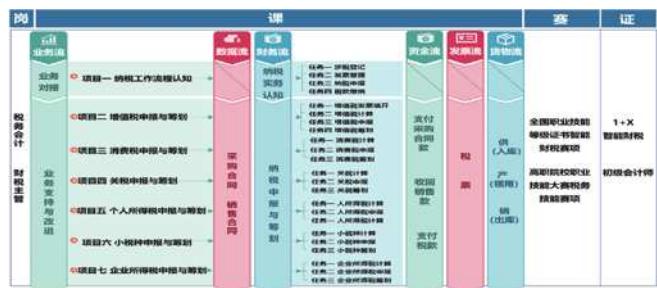
图 1 教学内容及整体设计

内容包括初识税务服务工作、流转税申报与筹划、所得税申报与筹划及小税种申报与筹划四个模块, 涵盖了增值税、消费税、企业所得税等 18 个税种。从税务会计和财税主管的职业技能出发, 在税种申报和征收管理的基础上融入了 1+X 智能财税及全国职业院校技能大赛企业税收风险及筹划、RPA 等人工智能新技术应用的内容, 实现岗课赛证融合。课程将税务处理知识、技能与会计知识、技能有机结合, 对纳税筹划、税务检查、税务代理能力的培养起着奠基作用, 教学内容及整体设计如图 1 所示: