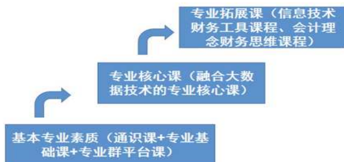
图 1: 构建大数据与财务管理专业课程体系基本框架

根据上述职业面向的分析及专业培养目标, 构建大数据与财务管理专业课程体系, 满足新一轮专业目录调整后的专业建设需要。课程体系调整的依据是(1)保留符合产业人才需求, 职业成熟稳定, 就业面向明确的课程;(2)合并业态或者岗位需求变化、技能重叠度高、核心内容交叉的课程;(3)新增面向“十四五”时期重点布局的产业、新业态、新技术、新职业等需要的岗位技能;(4)撤销相对应知识技能为淘汰类、低需求的课程, 不符合企业需求的课程。