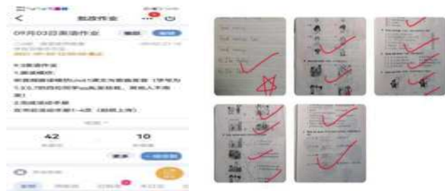
图 4 英语作业 图 5 老师批改后进行点对点的反馈

在英语教学中, 老师不仅要培养学生的语言能力, 也要关注到学生的学习能力的培养。在“听、说、读”领先的时候, 要注意“写”也要跟上。书面作业可以规范学生的书写习惯, 也可以提升他们思考, 审题, 分析等思维品质。但是学生随着年级的增长, 学科任务越来越重, 往往会对作业产生抵触的情绪, 能少写则少写, 能不写则不写。QQ 老师助手平台, 将信息技术和英语作业相融合。我每个周末在 QQ 老师助手上布置一次书面作业, 学生完成后把作业拍照上传到平台, 老师批改后进行点对点的反馈。让学生在写一写, 练一练的实操行为中, 巩固课堂所学。一周一次, 频率适宜, 不会让学生产生天天打卡的心理负担, 也给学生换换“口味”, 旧瓶装新酒, 别有一番风味。(图 4-5)