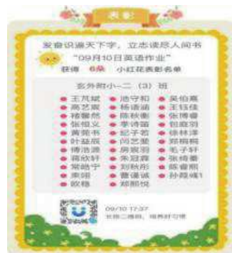
图 7 英语作业表彰名单