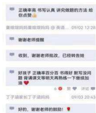
图 6 点对点的形式和学生交流

每位学生,每次作业,我都会第一时间反馈,积极地鼓励带给学生的是学习兴趣上的激励,学生体验到成功的快乐后学习的劲头会更足。对于作业中呈现的问题,我会以点对点的形式和学生交流,不打击学生信心的同时也起到纠正引导学习的目的。因此,用 QQ 老师助手评优分享,换来是师生共赢的结果。(图 6-7)