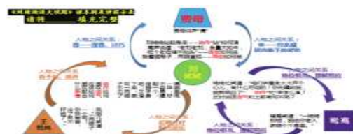
图 2、戏剧表演提示表

何：哦！我明白了。应该是平等合作关系。那老师我们再演一次……（这是利用“人际关系智能”解决了人物关系及其变换的问题）