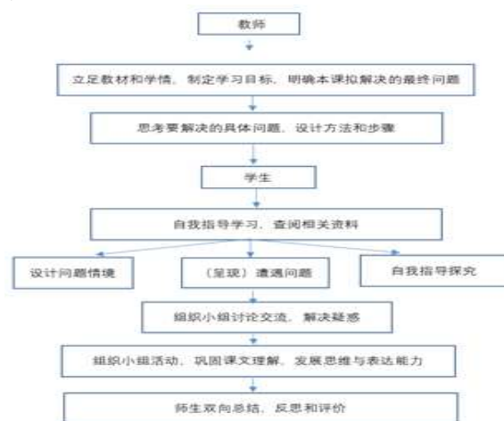
图1 PBL教学模式教学流程图

别是:(1)组织小组;(2)设计问题;(3)(呈现)遭遇问题;(4)自我指导学习;(5)尝试利用新知识循环往复解决问题;(6)学习过程中的总结、反思和评价(支永碧,2009)。根据基础教育阶段的评估方法和教学活动的多样性,本文给出了以下设计(见图1)。