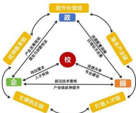
图1 “政园企校”四方协同产教联合体

上海工商职业技术学院锚定上海“3+6”新型产业体系及数字经济、绿色低碳、元宇宙、智能终端四大新赛道, 聚焦未来健康、未来智能、未来能源、未来空间和未来材料五大未来产业发展方向, 以市域产教联合体为平台, 以嘉定工业区经济发展和产业结构调整升级为契机, 以嘉定工业区产业链发展的先进制造技术、汽车智能化技术、芯片与信息化技术、高端医疗器械四个重点专业群为突破, 以提升高素质技术技能人才供给力为目标, 在教师队伍建设、教学资源开发、教研科研申报、技能大赛培训、社会服务孵化等方面与产业企业发展紧密融合, 构建“政园企校”四方协同产教联合体, 持续推进产教协同育人。