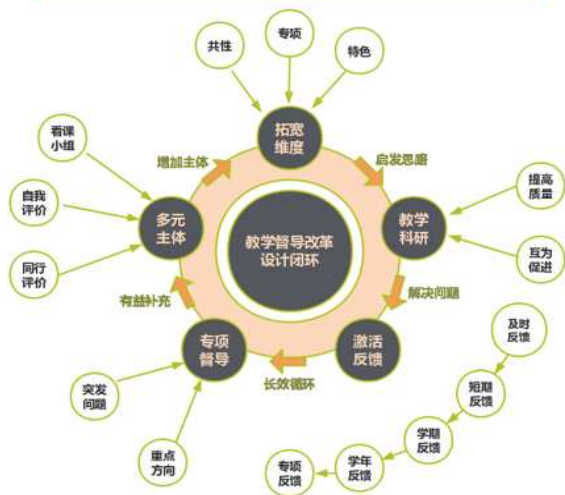
图3 《大学体育》教学督导改革内容图

1. 确定方向、设定标准——横向拓宽教学督导评价指标的维度。重新设计教学督导评价表,在一张表基础上增加自我评价表和同行评议表。突出教学主要过程,又全面覆盖各方面;评价表扩充评价范围,尽可能真实反映教师教学全貌,评价表问题数量从8个增至20个。评价指标内容丰富,包括教师、学生、教材、课程方面,评价更全面客观。教学督导指标分为大学体育课程通用的“共性指标”、不同项目的“分科指标”及教师授课风格的“特色指标”,从其在教和学两方面所产生的效果着眼,研究制订若干条指标供选择。