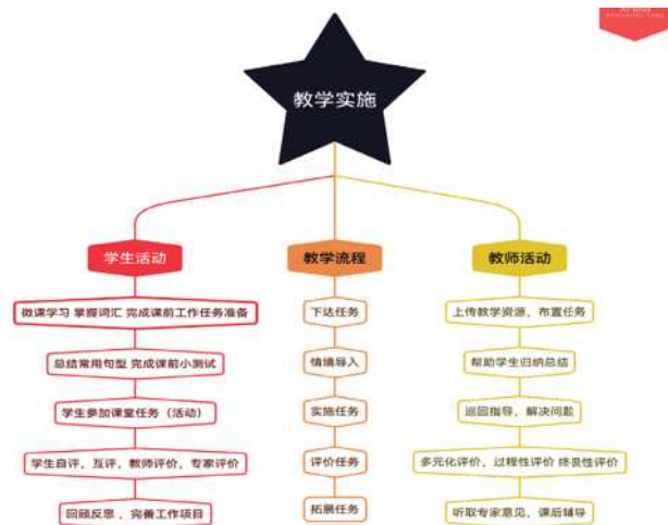
图2 任务实施流程图

英语学科工学一体化教学实施流程分为五步：下达任务、情境导入、实施任务、评价任务和拓展任务。在整个教学实施流程中，教师和学生双线并进，形成一种协同的教学过程。（如图2）这种教学实施流程体现了工学一体化教学的理念和特点，能够有效地提高英语学科的教学效果和学生综合素质的培养。